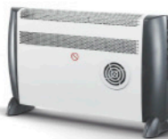
CN 201 ZF